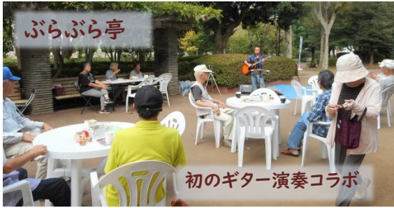
初のギター演奏コラボ

「ぶらぶら亭」の秋シリーズは9月22日から12月1日までの毎週日曜日午前10時から午後4時まで開催しております。秋シリーズでは、ギター弾き語りや野外コーラス、わくわくゲーム、ハーモニカ演奏、カントリーダンス、ビンゴ大会など様々な催し物を予定しています。詳しくは大山公園「ぶらぶら亭」ログハウスの予定表をご覧ください。(※悪天候の場合は中止となります)