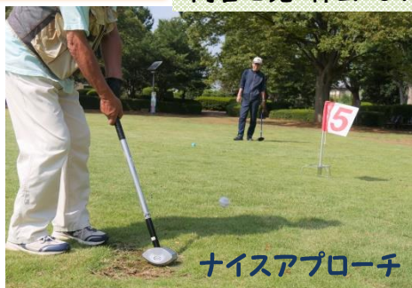
ナイスアプローチ