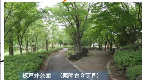
板戸井公園 (薬師台3丁目)