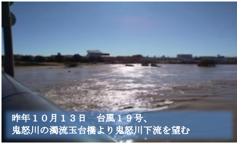
昨年10月13日 台風19号、鬼怒川の濁流玉台橋より鬼怒川下流を望む

鬼怒川緊急プロジェクトの一環で鬼怒川玉台橋から一里塚までの築堤工事が完成しました。場所は松前台3丁目と大山新田をつなぐ道沿いの一里塚の取水口付近から玉台橋までの往復約1.6km、夕焼けが川面に映り、反対側には筑波山が望めます。この堤防をぜひ散歩してみてください。北守谷には遊歩道が縦横に広がっており、体力に応じた色々なコースを安全に散歩できます。皆さんが発見した北守谷の新しいみどころ写真を編集部までお寄せ下さい。お待ちしております!