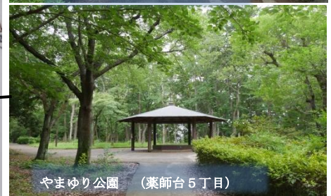
やまゆり公園 (薬師台5丁目)