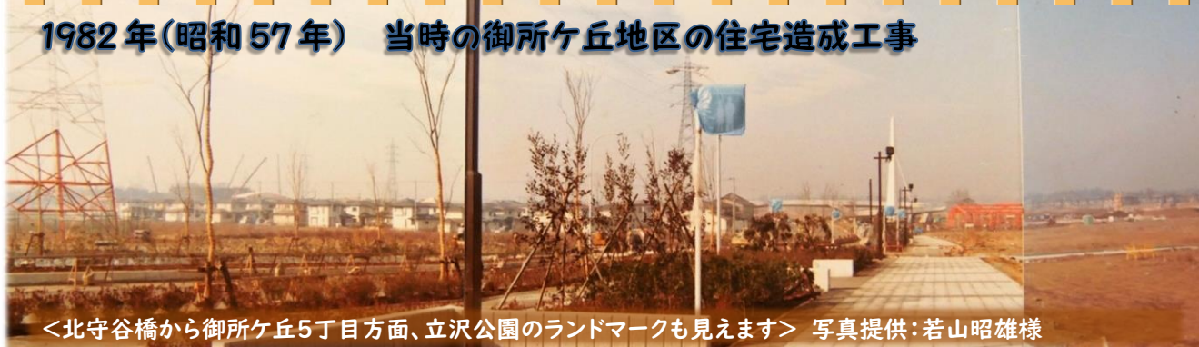
1982年(昭和57年) 当時の御所ヶ丘地区の住宅造成工事