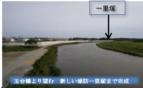
玉台橋より望む 新しい堤防一里塚まで完成