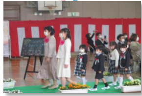
入学式もマスク着用で

学校生活では、休み時間をずらしたり、児童の帰宅後に机・椅子・ドアノブ・水道蛇口等、手の触れる部分の消毒などの感染予防対策を先生方が毎日行ってくださっています。