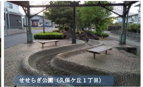
せせらぎ公園 (久保ヶ丘1丁目)