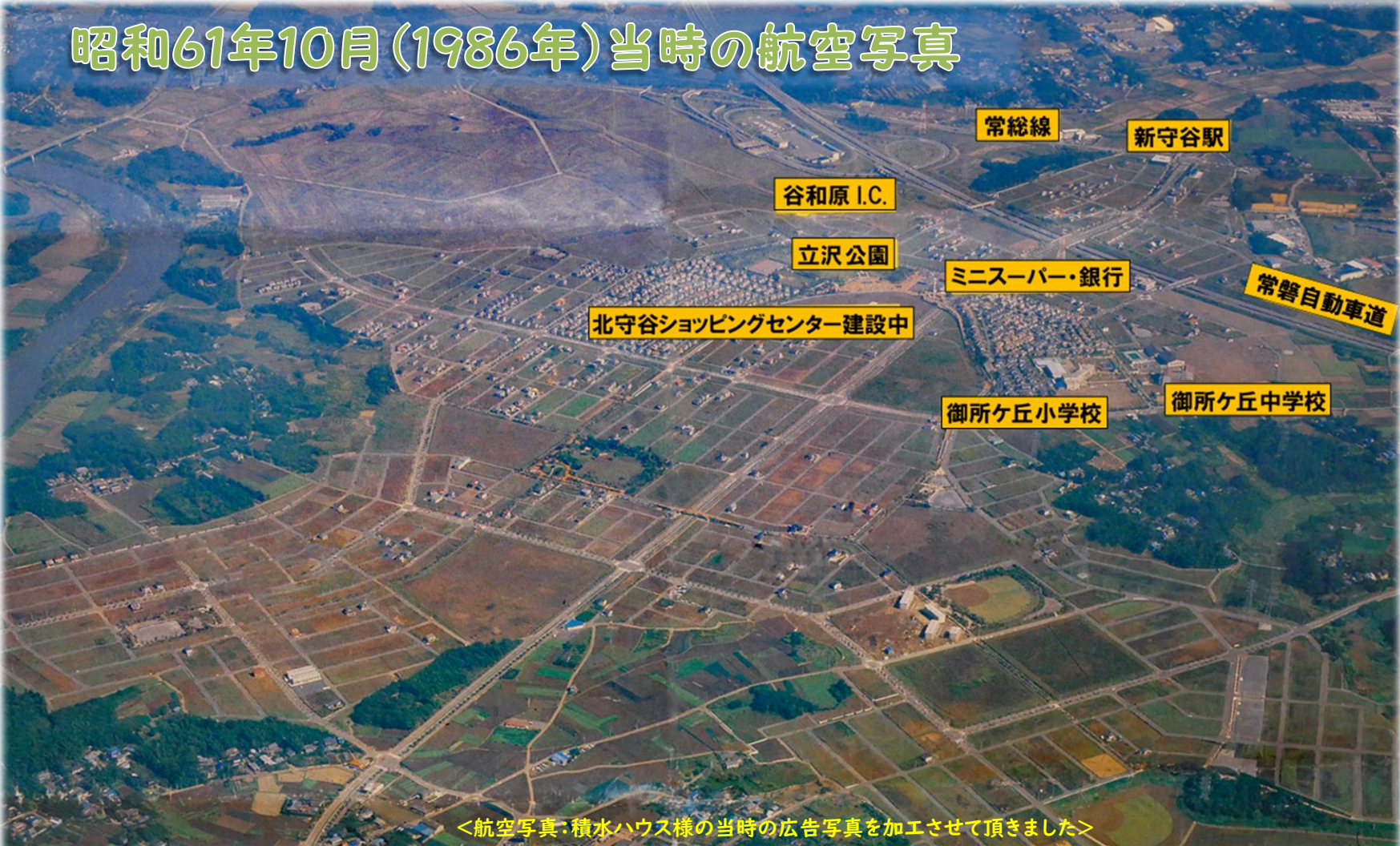
<航空写真・積水ハウスの当時の広告写真を加工させて頂きました>

防災・防犯・交通安全部会 (R2事業 予算 75万円) ○ 今年度は地区内3小学校で“コロナ対策”を想定した学校・地域避難訓練を実施する方向で検討していきます。 ○ 防犯ながらパトロールの実施 (子どもの見守り活動)