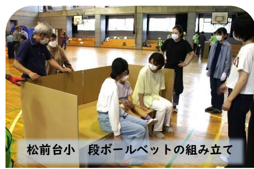
松前台小 段ボールベットの組み立て