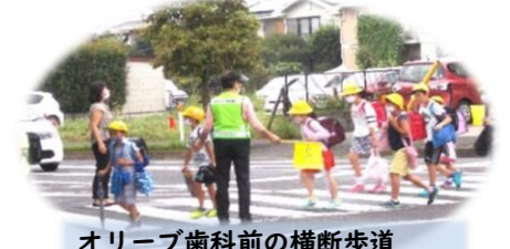
オーリーブ歯科前の横断歩道

見守り活動 御所ヶ丘小学校の見守り活動については8月末をもって御所ヶ丘小学校のPTAの皆様にご協力いただきました。見守りをしていた仲間が高齢となり、募集しても全く集まらず存続が問題となっていたため、協議の結果PTAの皆様をお願いすることになりました。しかし、オーリーブ歯科の交差点は交通量も多く危険なので従来通りまちづくり協議会より見守り活動をお手伝いします。