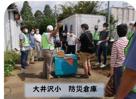
大井沢小 防災倉庫