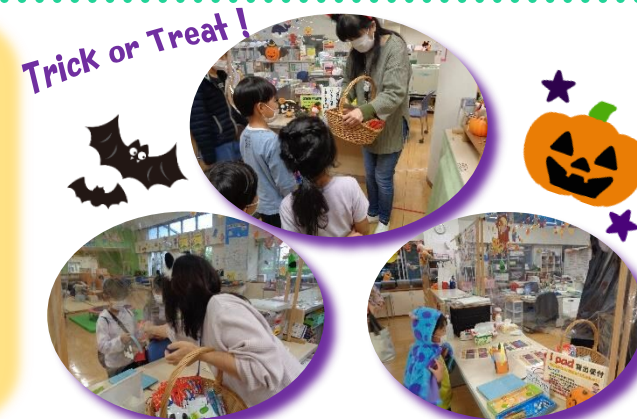
Trick or Treat!

「出来たー!」と笑顔の小学生。自作のハロウィンバックを仕上げ、自慢そうな顔です。その姿を見て年長さんもバック作りを頑張りました。バックが出来上がった子ども達は、合言葉「Trick or Treat!」を職員に大きな声で返してくれました。お菓子をプレゼントすると「お菓子ゲット!ありがとうございます。」と飛び跳ねながら友達の輪の中に入っていました。今年のハロウィンinキ・ターレでは、10月25日~31日迄の期間に牛乳パックをリサイクルしてバックを作り、合言葉でお菓子をもらうというイベントを行いました。土日は、市民活動支援センターの皆さんも参加し、大盛り上がりハロウィンとなりました。