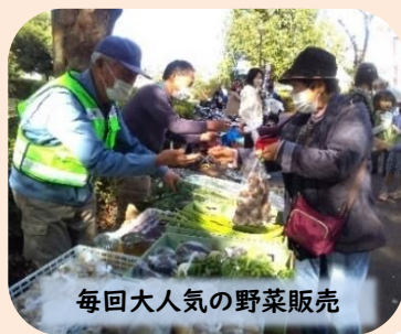
毎回大人気の野菜販売