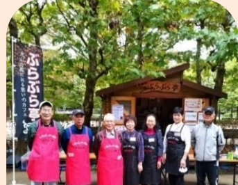
ぶらぶら亭スタッフ