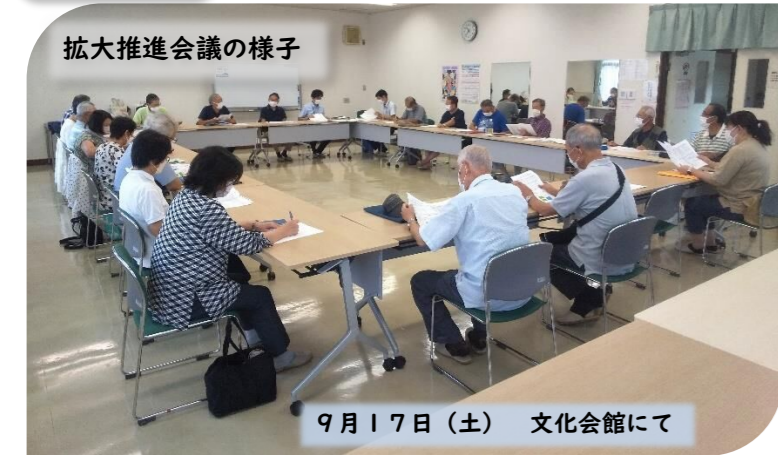
拡大推進会議の様子