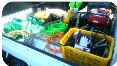
工具、道具も大分揃えました