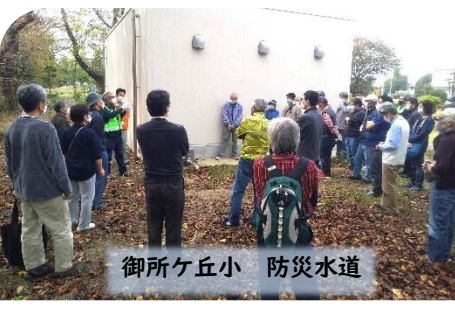
御所ヶ丘小 防災水道