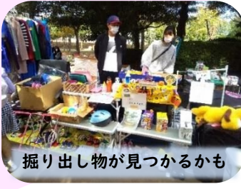
掘り出し物が見つかるかも