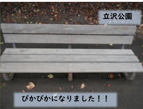
立沢公園 ぴかぴかになりました！！