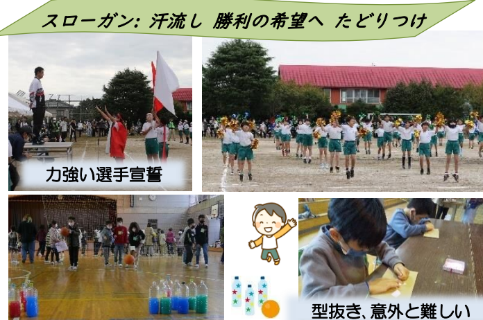
スローガン: 汗流し 勝利の希望へ たどりつけ

1日延期で10月16日(日)に運動会が開催されました。青空のもと児童代表による選手宣誓が行われ競技開始!3年ぶりに全校児童がグラウンドに揃っての運動会となりました。表現種目では、児童が一生懸命練習してきた成果を発揮し、生き生きとした表情でダンスを披露していました。11月1日(火)の松前台小ふれあいまつりは、1・2年生、3・4年生、5・6年生の各ブロックに分かれて体育館で実施されました。保護者手作りのふれあいまつりは、射的、ボウリング、型抜き、ストラックアウトなどが行われ、児童は楽しいお祭りの雰囲気を楽しんでいました。