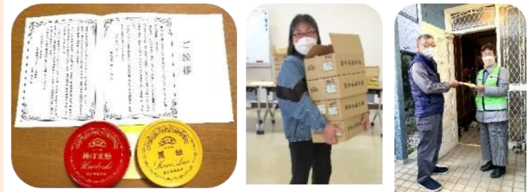
記念品の「飴」2種類 民生委員さんがお届けしました

今年度は3年振りに11月5日に敬老会を実施する方向でプロジェクトを立ち上げましたがコロナの感染状況を鑑み、記念品をお贈りすることに変更しました。対象人数は2000人余、色々検討した結果、記念品は伝統ある栄太郎飴に決めました。75歳以上のお一人様世帯には黒糖飴、お二人様世帯には黒糖飴と梅ぼ志飴です。SDG'sの典型的な創業200年超の老舗会社の高級飴、挨拶状と共に各地区の民生委員がお届けしました。喜んで頂けたでしょうか。