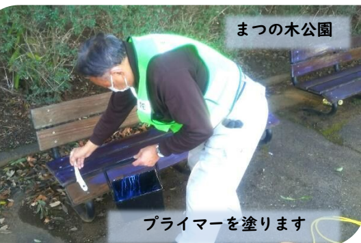
まつの木公園 プライマーを塗ります