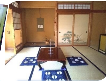
茶室として使われます