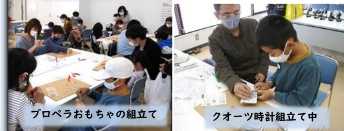
プロペラおもちゃの組立て