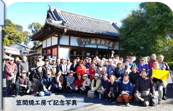
笠間焼工房で記念写真

北守谷交流サロンのバス旅行 秋晴れの10月26日、市社協北守谷支部主催の「笠間稲荷菊まつり見学と笠間焼手ひねり体験」日帰り旅行がサロンやシニアクラブの協力により、参加者51名で実施されました。今回、当日一人の不参加もなかったことは、12回目の中で初めてのことです。高齢者の皆様方が仲間同士で会話し、食事し、旅行することを、如何に期待していたのか、の証でした。