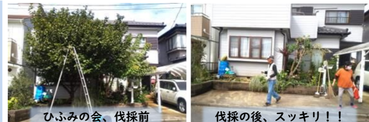
ひふみの会、伐採前 伐採の後、スッキリ!!

助け合いの会 活動を発足したいという自治会が増えています。先日、「貴方の町に助け合いの会を作りませんか」というチラシを戸別配布いたしました。地域福祉部会で最も力を入れている今年の目標です。是非各々積極的な検討をして頂き、各町内会または自治会で実現して頂きたいと願っています。