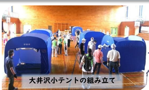
大井沢小テントの組み立て