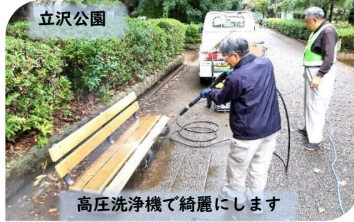
立沢公園 高圧洗浄機で綺麗にします