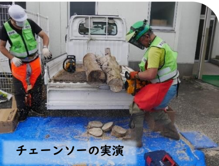
チェーンソーの実演