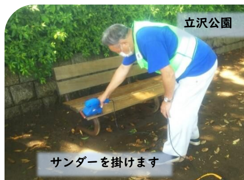
立沢公園 サンダーを掛けます