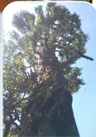
守谷市の保存木に認定された榎の大木