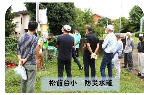
松前台小 防災水道