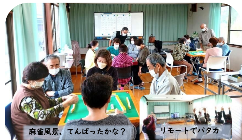
麻雀風景、てんぱったかな?

東板戸井サロンは2016年に健康麻雀グループ、カルチャーグループでスタート。健康麻雀グループのほとんどが初めての人でスタートでしたが今は役満が上がる状況の人もでてきて、人数も19人になり、皆さん月曜日が待ち遠しいと言っています。開催日:第1,3,5月曜日。カルチャーGも手芸サークルとしてのスタートが、今では認知症勉強会:第2,4金曜日(市役所からのご指導)、音楽会:第2,4火曜日、などが加わり、楽しく運営しています、新メンバーの加入を期待しています。