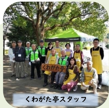
くわがた亭スタッフ

コーヒーを飲みながらの歓談に加え、子供たちは、タングラム、紙ヒコーキ、プラレールなどを楽しみ、にぎやかになってきました。