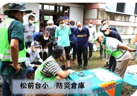
松前台小 防災倉庫