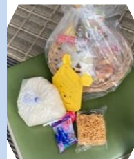
袋詰めて テイクアウト

10月22日(土)の内容は【基本食材】パン2個、バナナ、野菜ジュース、魚肉ソーセージ + 【寄附食材】お米、お菓子いろいろ、ジャガイモ！ 2つの袋を両手に、子どもたちの嬉しい笑顔が広がりました!!