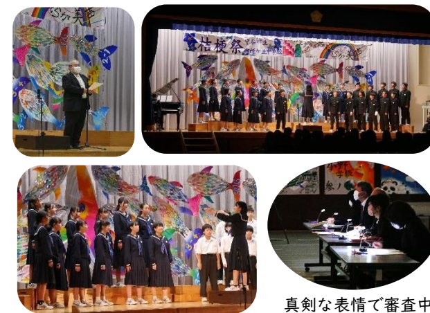
真剣な表情で審査中