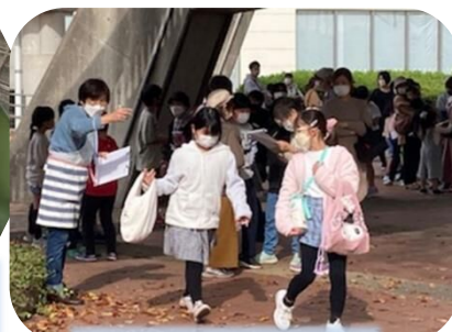
今日はありがとう!!