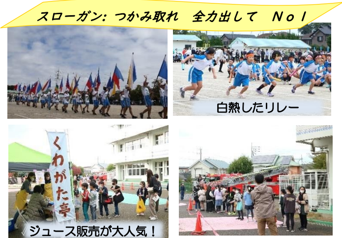
スローガン: つかみ取れ 全力出して No.1

11月5日(土)はワイワイおおいさわが開催。児童のみで午前中開催でしたが学年毎の楽しいブースに加え、今年は初の消防署の参加で、ハシゴ車の説明と記念撮影が行われました。「くわがた亭」、「おもちゃ病院」も参加し両ブースとも大賑わいでした。