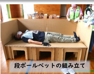
段ボールベットの組み立て