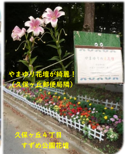
久保ヶ丘4丁目 すずめ公園花壇