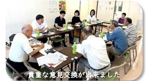
貴重な意見交換ができました