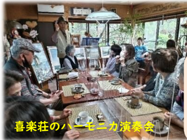
喜楽荘のハーモニカ演奏会

今年度春シリーズのフリーマーケットもぶらぶら亭とのコラボで実施しました。4月30日の初の立沢公園での開催は、大変残念ながら雨で中止となりました。その他の開催日はお天気に恵まれ、賑やかに開催することができました