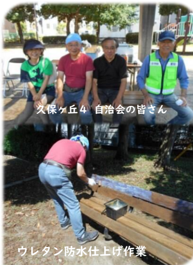
ウレタン防水仕上げ作業

また、日頃気づいた危険箇所などは守谷市公式アプリ「Morinfo」で市役所宛に投稿ができます。