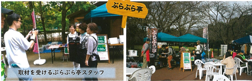
取材を受けるぶらぶら亭スタッフ

交流活動部会は5事業を中心に交流の輪（和）を広める活動を行っています。『喜楽荘』は写真展や油彩画展など芸術家の作品展も開催しています。『フリーマーケット』は北守谷地区の出店者が多彩な商品と笑顔でお迎えし、大山公園・立沢公園でのフリマの開催を行っています。『多世代交流事業』は中央公民館でのライトレースカー作成教室やどこでも茶屋でおもちゃ病院を開催し子供たちの人気を集めています。『くわがた亭』は健康体操や野菜販売更に無料税務相談会、タングラムなど多彩なイベントを開催しています。『ぶらぶら亭』はハーモニカ演奏会やくじ引きなど、子供たちにも楽しんで頂いています。暖かさが恋しいこの季節、美味しいコーヒーを飲みぜひお出かけください。