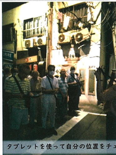
タブレットを使って自分の位置をチェック、QRコードで災害時のポイントを確認

シミュレーション技術をうまく導入した素晴らしい映像やジオラマですが、出来れば体験型の防災センターの方が印象的で良かったかもしれません。