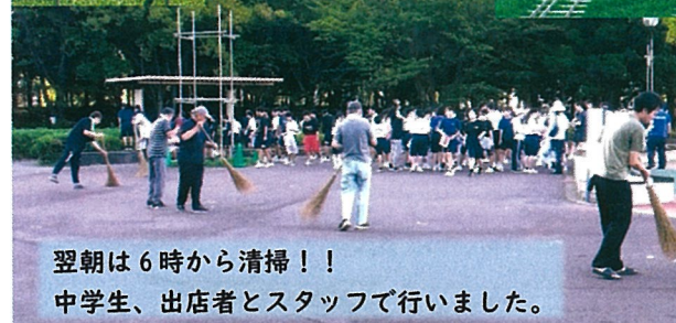
翌朝は6時から清掃!! 中学生、出店者とスタッフで行いました。