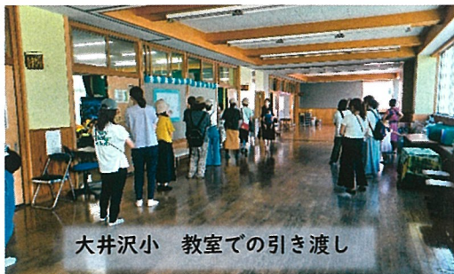
大井沢小 教室での引き渡し

9月1日(金)午後2時半より小中学校での児童・生徒引き渡し訓練があり、まち協からも参加しました。保護者の方の関心が非常に高く、各学校95%以上の保護者が引き渡し訓練に参加しました。午後3時半からは学校防災倉庫や教室の見学がありました。地域住民の方の参加は多くありませんでしたが、今後は徐々に浸透してくるものと思います。