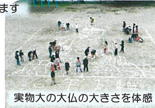
実物大の大仏の大きさを体感