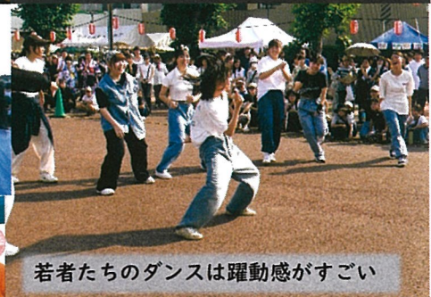
若者たちのダンスは躍動感がすごい