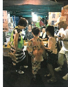
まち協の夏祭りのブース。子どもくじに長蛇の列!