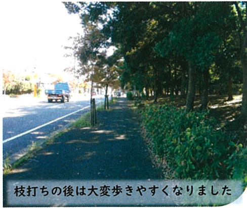
枝打ちの後は大変歩きやすくなりました