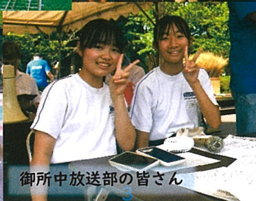
御所中放送部の皆さん