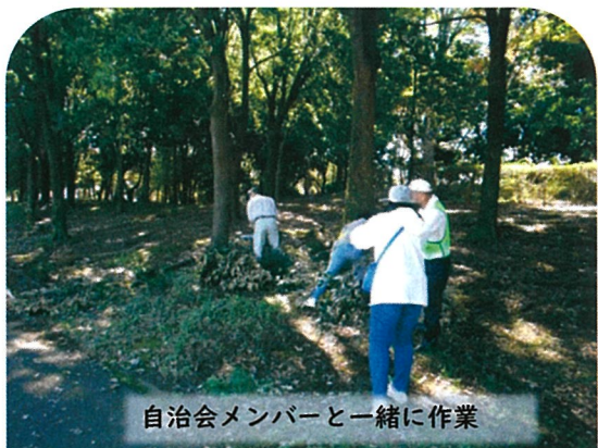
自治会メンバーと一緒に作業