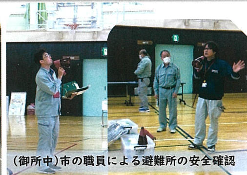
(御所中)市の職員による避難所の安全確認