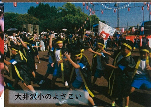
大井沢小のよさこい