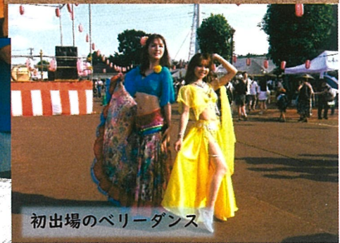
初出場のベリーダンス