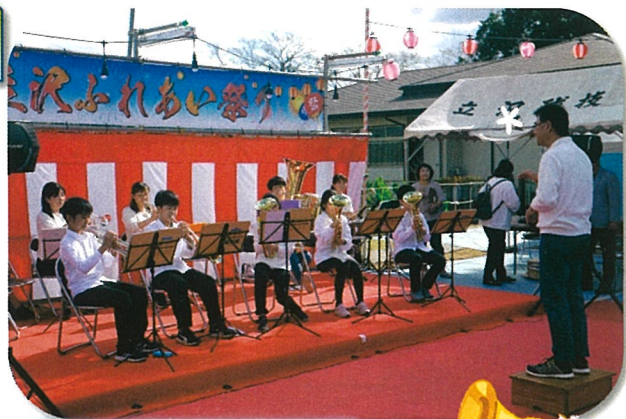
立沢秋祭りでの演奏