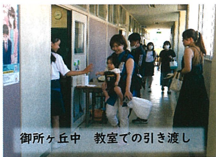
御所ヶ丘中 教室での引き渡し