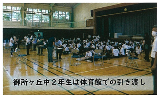
御所ヶ丘中2年生は体育館での引き渡し