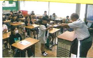
校長先生が教室で表彰します