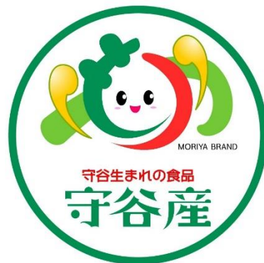
守谷生まれの食品ロゴマーク