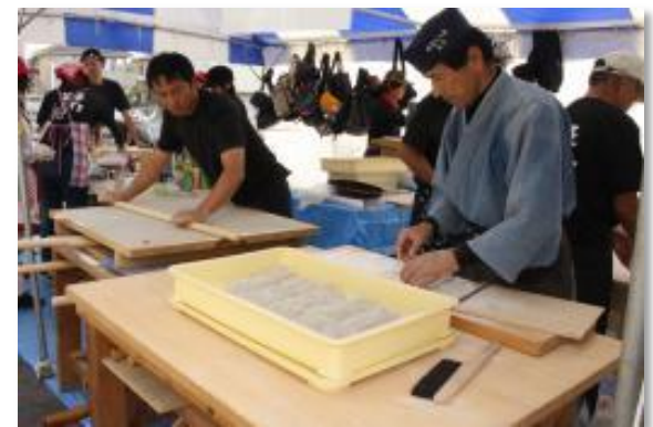
そば販売(守谷市商工まつり)