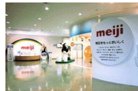
株式会社明治 守谷工場「明治みるく館」