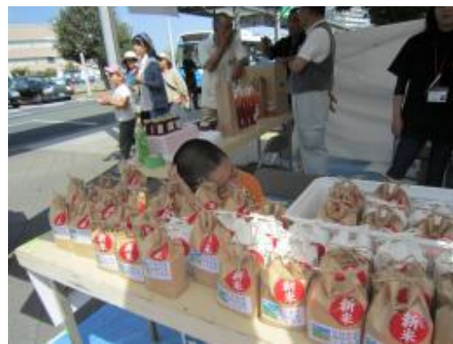
米のPR販売(守谷市商工まつり)