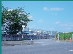
■ TX 車輛基地南側道路入口