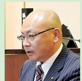
田中 啓一 議員