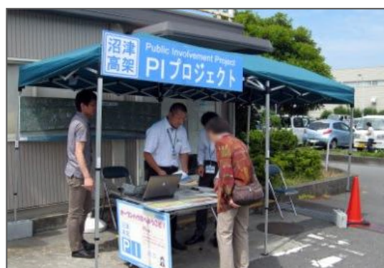
オープンハウスのイメージ（沼津市の例）