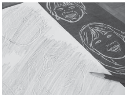
作品：「笑う机 / smile on the desk」