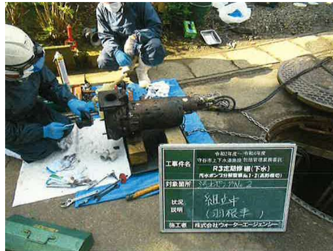
汚水ポンプ分解整備