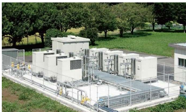
消化ガス発電施設