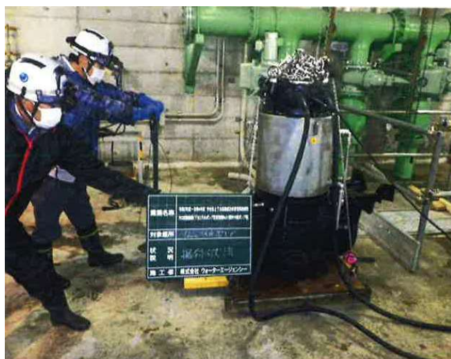
汚水ポンプ更新整備