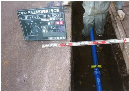
布設替工事(老朽管更新)状況