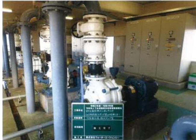
No.5守谷系配水ポンプ逆止弁交換工事