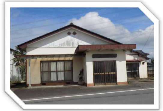
大八洲大原公民館