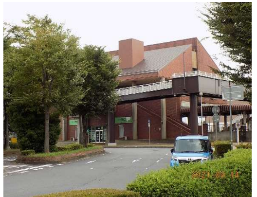
関東鉄道新守谷駅付近