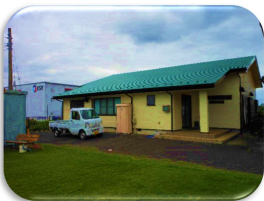
外装も新たに原自治会館

毎年夏には、夏祭りが開催されていましたが、ここ 2 年コロナ禍の影響により中止となっています。一日でも早く日常の生活に戻ることができるようお願いしております。