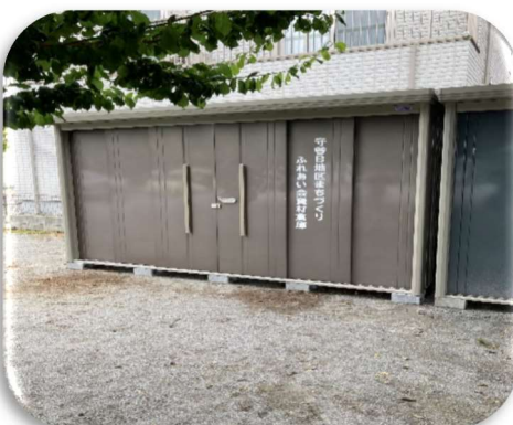
松並東自治会館広場