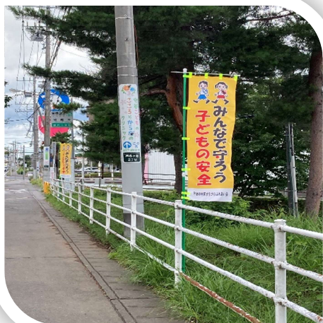
B地区見守り活動 黒内小前通り

8月7日「B・C地区市長とまちづくり協議会の意見交換会」（守谷市役所・大会議室にて）