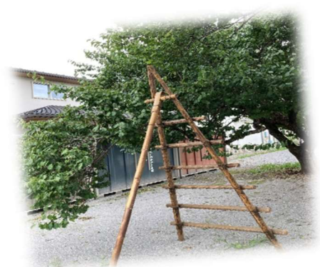
広場植栽の伐採作業