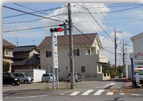
原本町入口付近（原公民館通り）

新型コロナウイルスの終息を願い、元の生活に近づけるようお願いしています。今後ともよろしくお願いいたします。