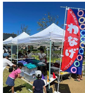
ランチ守谷夏祭りB地区ブースの様子