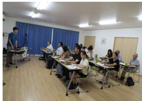
B地区防災講習会の様子