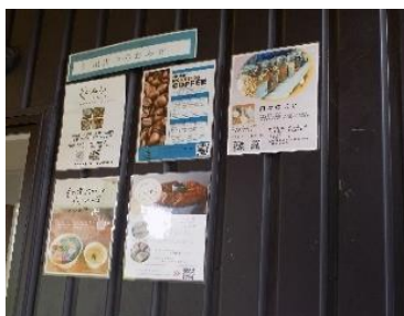
各お店の案内メニュー