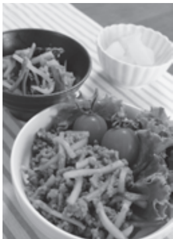
▲家庭で給食の味を再現!