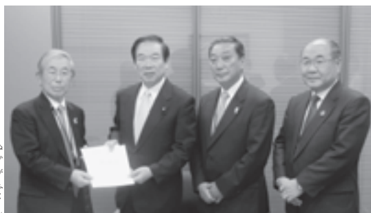
▲各市町村の実情に応じた対策を要望！

県市長会（会長＝守谷市長）と県町村会とは合同で、10月22日、国への要望活動を行いました。