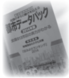
▲都市の実力をランク付け

「住みよさランキング」は、東洋経済新報社が全国791都市を対象に、それぞれの市が持つ「都市力」を調査。主に「安心度」「利便度」「快適度」「富裕度」「住居水準充実度」の5つの指標に基づいて、ランク付けしています。