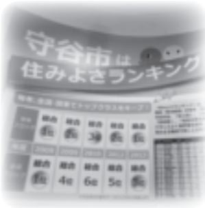
▲毎年トップクラスをキープ！

毎年6月に発表される「住みよさランキング」。今回、守谷市は総合5位！県内では1位！