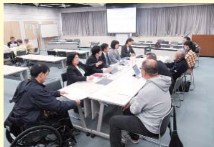
保健福祉常任委員会