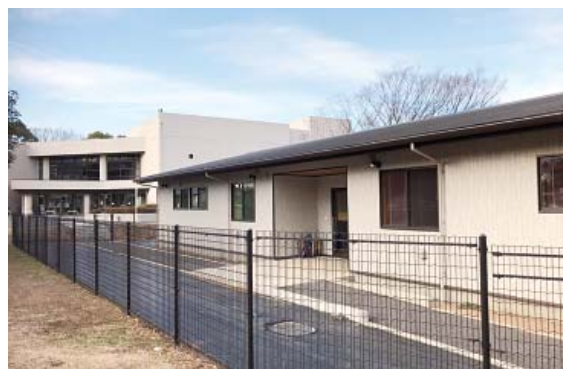
黒内小学校児童クラブ

児童クラブの建設場所に困っている状況である。今後は、民設民営型の児童クラブも検討し、子どもたちの受け皿の一助となれればと考える。