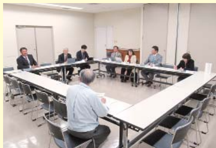
総務教育常任委員会

常任委員会ごとに分かれて行った意見交換会では、議会だよりやふるさと納税、デマンドタクシー、不法投棄、子育て支援、高齢者の働く場所など、さまざまなご質問やご意見をいただきました。