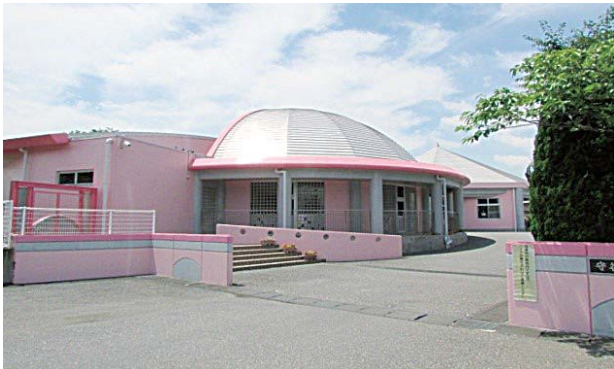
北園保育所で実施します

A 保育所という安全が保たれた環境であることや、保育所の駐車場をそのまま利用できること、市民にとって分かりやすい場所であることなどから決定しました。