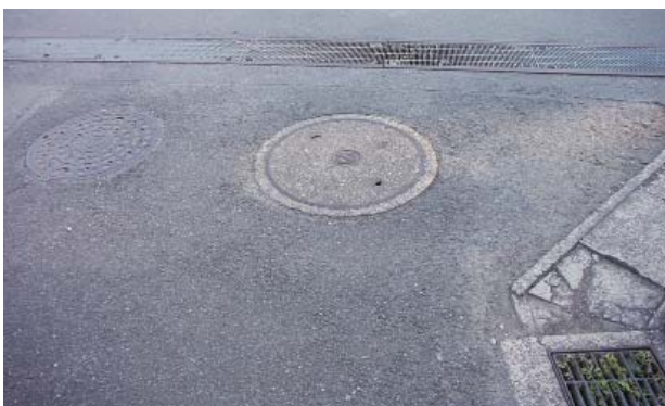
マンホール蓋を新しくします

A 長寿命化計画で対象としている543基のうち、486基が今年度中に完了する見込みであり、平成31年度に予定していた残りの57基について、今回前倒しで実施するものです。なお、今後も老朽化に伴う蓋の交換は、継続的に実施します。