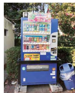
災害対応型自販機（桜の杜公園トイレ脇）