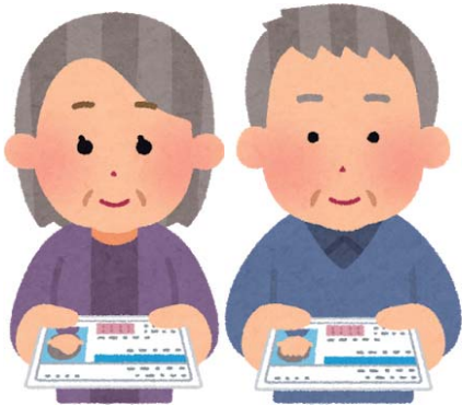
免許返納者にバス回数券を配布