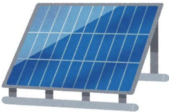
適正な設置を推進します