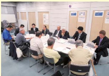
都市経済常任委員会