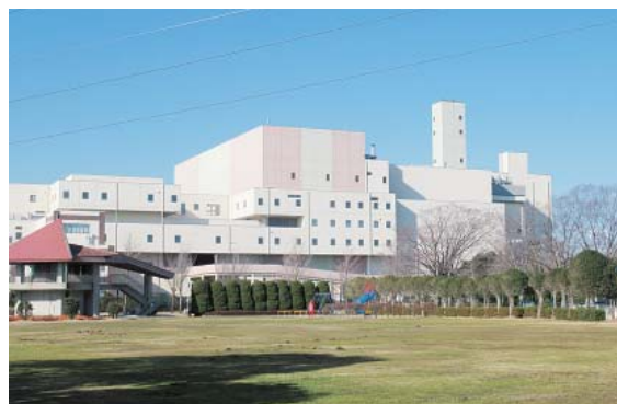
常総環境センター