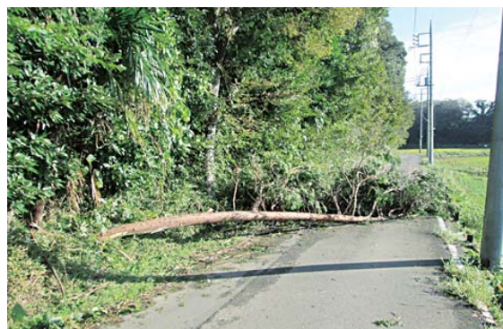
台風による倒木被害

A 正規職員 370 名、非正規職員 370 名（内訳は臨時職員 32 名、非常勤一般職員 148 名、嘱託職員 190 名）の半々。非正規職員は正規職員が担う事務の補助的な業務を行っている。