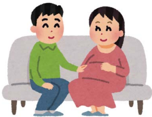
免除申請を忘れずに！

A ホームページ等を利用した広報や、母子手帳交付の際に周知したいと考えています。