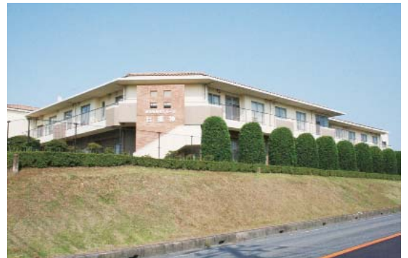
特別養護老人ホーム待機者ゼロへの取組みを