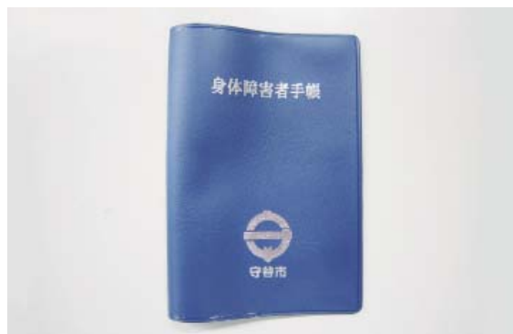
障がい者手帳の所持者数は増加傾向に

が利用できる事業所が県内では少ない状況であるが、市内の医療機関において開設準備の検討が進められており、相談等の支援に努めたい。