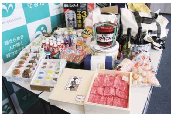
返礼品は 260 品目