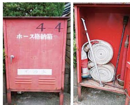
市内に 527 箇所あるホース格納箱

軽減には取り組んでいるが、教職員にはその実感は薄いと認識している。授業の充実のため時間の確保・教職員の健康は欠かせない。県・校長会と連携し負担軽減・業務改善に努めていく。