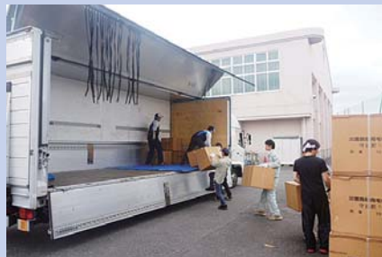
被災地へ救援物資を輸送するため、防災倉庫から備蓄品を運び出す。