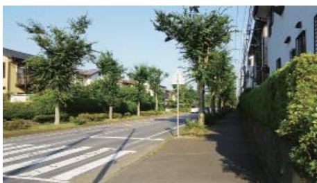
みずき野地区がモデル地区に

A 交付金がもらえない場合も想定していますが、そうなった場合、費用を再度精査し、市単独費でもできるよう検討していきたいです。