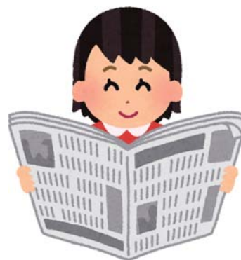
新聞を教材として活用する NIE 教育

を育む上で、重要な役割を果たすものとする。これから、変化の激しい時代を生きていく子どもたちのために必要。また、守谷市の教育目標である新しい時代をたくましく生きる力の育成にもつながる。