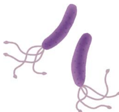
胃がん発生リスクを 5 ～ 10 倍にするピロリ菌

A 今後、市の特定健診の項目に個人負担によるオプションで追加することについて、取手市医師会と協議する。