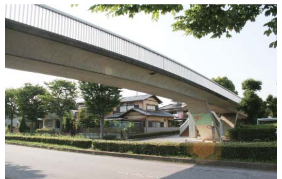
松前台と薬師台に架かる深田歩道橋

の破片等が落下するといった橋梁の危険性もあるため、長寿命化修繕計画による大々的な修繕をする前に応急的な修繕をしている状況である。