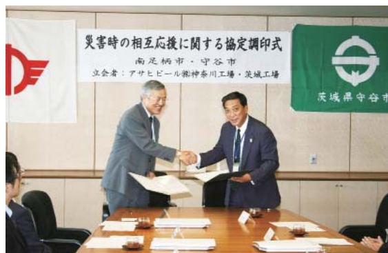
平成 17 年に南足柄市と「災害時相互応援に関する協定」を締結

ムーズに受援をする為に、受け入れ側として守谷に来て活動していただく方に地理的な情報も含め、どれだけ有用な情報を提供できるか、準備や体制づくりを進めていきたいと考える。