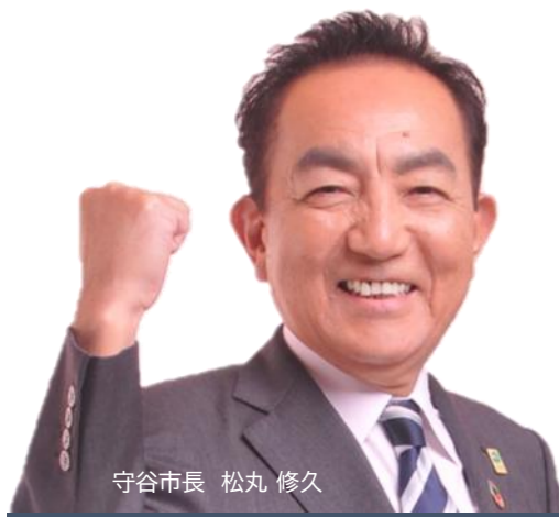
守谷市長 松丸 修久