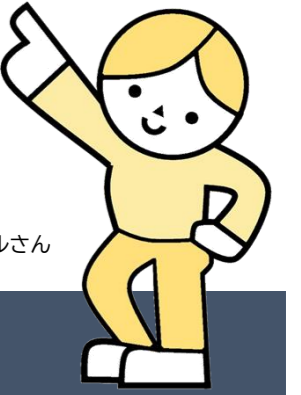
ニューノーマルさん

わくわく子育て王国 Open-Hearted Moriya Kids, Open-Minded Moriya Families.