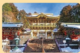
令和7年 日光東照宮