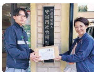
▲鴻池運輸株式会社様 (左)