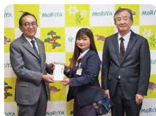
◀古河ヤクルト 販売株式会社 様 (右)