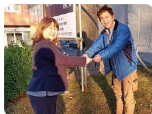
▲新規地域食堂へ指定寄付 (株式会社前川製作所様から)