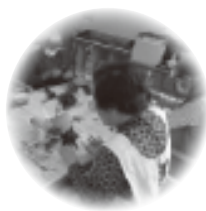
【フラワーアレンジメント】

社会福祉法人 英伸会 ✿ テイサービスセンター七福神 ✿ 【見学・体験】できます!