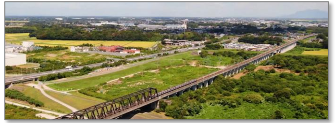
▲つくばエクスプレス利根川橋梁上空から守谷市を望む

守谷市では、2016（平成28）年8月に「第2次守谷市環境基本計画」を策定して以降、「第三次守谷市総合計画（第2期守谷市まち・ひと・しごと創生総合戦略）」や「第二次守谷市緑の基本計画」により、環境施策の基本的枠組みを定めるとともに、市民・事業者・行政が一体となって、豊かな自然環境の保全や、快適な生活環境の実現、環境保全に向けた活動の各分野の施策事業に取り組んできました。