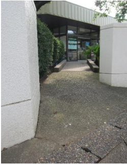
スロープの改善 現況勾配13.4%