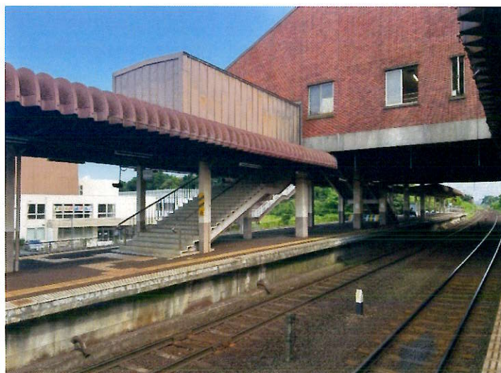
・ホーム階 (エレベーター設置・階段改善等)