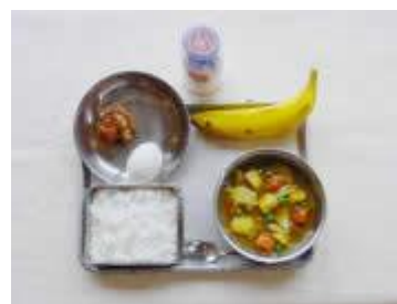
《昭和55年》 カレーライス 牛乳 ゆでたまご 福神漬け バナナ