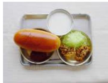
《昭和27年》 コッパン 脱脂粉乳 くじらの竜田揚げ せん切りキャベツ