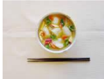
《昭和17年》 すいとんのみそ汁