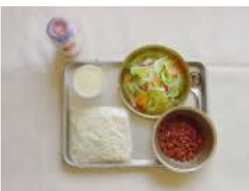
《昭和44年》 ソフトめん ミートソース 牛乳 フレンチサラダ プリン