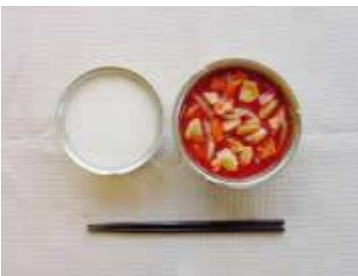
《昭和22年》 脱脂粉乳 トマトシチュー