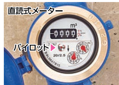
3 蛇口を全て閉めているのにパイロットが回る場合は漏水の可能性があります。（微量の漏水ではパイロットが1周するのに1～2分程度かかることがあります。）