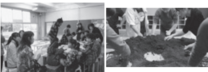
オープンスタジオの様子

寒さが一段と厳しくなる季節ですね。招へいアーティストたちは滞在の成果発表である第2回目のオープンスタジオを終了し、ほっと一息ついているところです。12月中旬には、彼らは帰国の途につきまます。