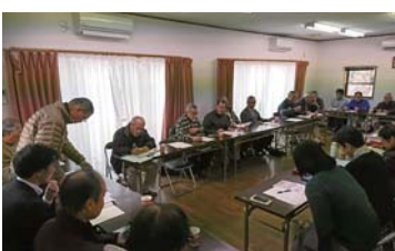
▲北守谷地区における協議の様子