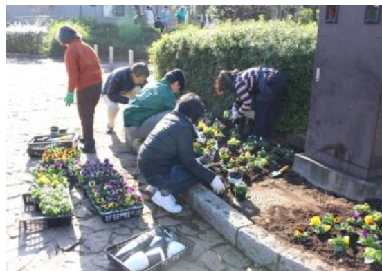
里親団体による花苗の植付け