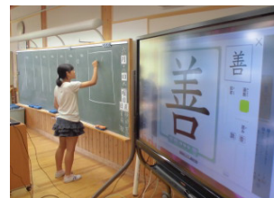
デジタル教科書活用授業

各教科で必要とする教材の購入に加え、老朽化に伴う教材を買い替えるとともに、児童生徒用の図書を購入する。また、中学校教科用図書採択替に伴い、これに準拠したデジタル教材(ソフト)を購入する。