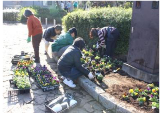
里親団体による花苗の植付け