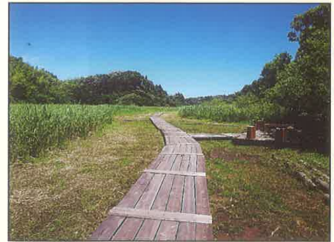
全面更新された鳥のみち (木の道) ~山王下口周辺~