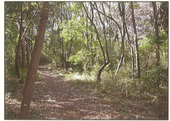
守谷野鳥の森散策路 (土の道) ~南ルート~