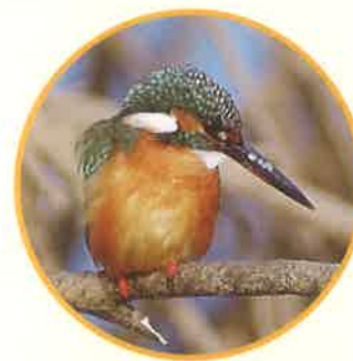
水辺の宝石カワセミ