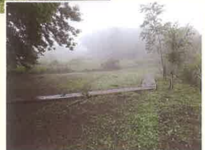
水辺広場の木煉瓦道

※守谷野鳥の森散策路と守谷城址を結ぶ鳥のみち (木の道) 総延長 1.5km 中心の新しい木道は、幅 1.4m 板厚 7-15cm 総 延長 720m、歩きやすく、歩いて楽しい 市民が心をこめてヒノキ原木から削り出した厚 板の質感が足元から心地よく伝わって 広々とした湿地草原と斜面林、東京近郊では珍 しい、大規模でなつかしい里山に木道が溶け込 んでいきます