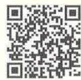
バス路線図 時刻表