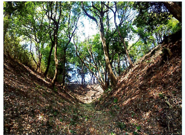
楯形曲輪南の空堀