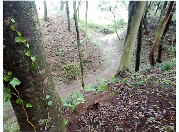
二の曲輪から見下ろした比高12mの空堀