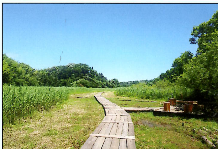
守谷野鳥のみちの、歩きやすい本格的な木道

住みよいまち守谷市の中心市街地の身近な大規模 緑地。そこには、市民が主力となって行政と力を 合わせて護り育てている日本の原風景があります。 市民手づくりの本格的な自然歩道と、市民の熱意 で環境整理された戦国時代の土の城の遺構を、野 鳥たちと一緒に楽しみ学べる、素敵な空間です。